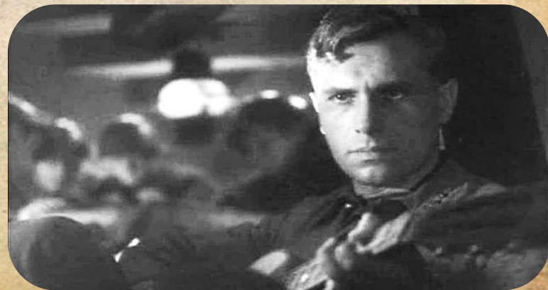
Марк Бернес исполняет песню «Тёмная ночь» (кадр из х/ф «Два бойца»)

Специально для фильма «Два бойца», снятого в 1943 году, композитором Никитой Богословским и поэтом Владимиром Агатовым была написана лирическая песня «Тёмная ночь». Она приобрела огромную популярность и стала одной из наиболее любимых песен, созданных во время Великой Отечественной войны.