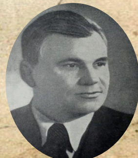
Василий Соловьев-Седой Александр Чуркин