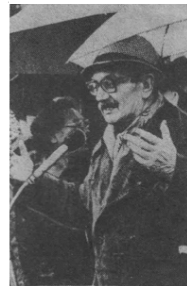
Константин Есенин выступает на открытии музея в Спасс-Клепиках