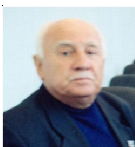
В.Н. Савельев Константин Сергеевич Есенин