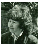
Г.П. Иванова “Как живой с живыми говоря...”