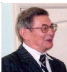
В.М. Касаткин Из записок краеведа “Легла дорога в Константиново”