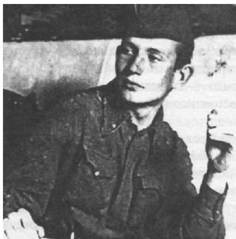
Армейская юность Константина Есенина